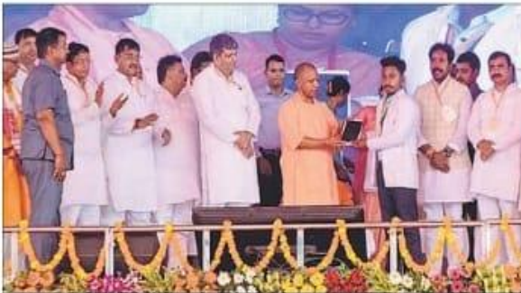
वर्षा जी के सोनपुर घाट में सोनपुर को मुहम्मद जैसी अतिथिमान ने सम्बोधित कर धरम दिवस का शुभारंभ किया।