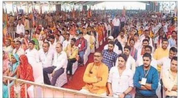
मुहम्मद जैसी अतिथिमान के कार्यक्रम में जिले के विभिन्न इलाकों में बड़ी संख्या में लोग पहुंचे। उन्होंने सोनपुर को मुहम्मद जैसी के बारे में जानकारी हासिल की।