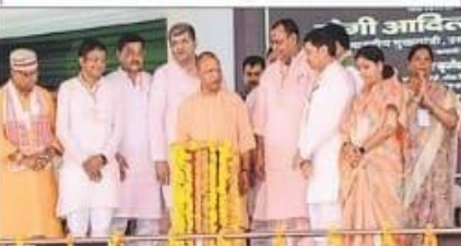
वर्षा जी के सोनपुर घाट में सोनपुर को मुहम्मद जैसी अतिथिमान ने शिलान्यास किया।

मिर्जापुर, बरहमपुर, मधुवादास। प्रधानमंत्री मोदी अतिथिमान ने जिले के पांचों विस क्षेत्रों में विकास के लिए 764.97 करोड़ रुपये की 127 परियोजनाओं की शिलान्यास की। उन्होंने 76 नई परियोजनाओं का शिलान्यास किया, जिसमें 620.44 करोड़ की लागत पर 156.13 करोड़ की लागत से 23-23 नई परियोजनाओं का शिलान्यास किया गया।