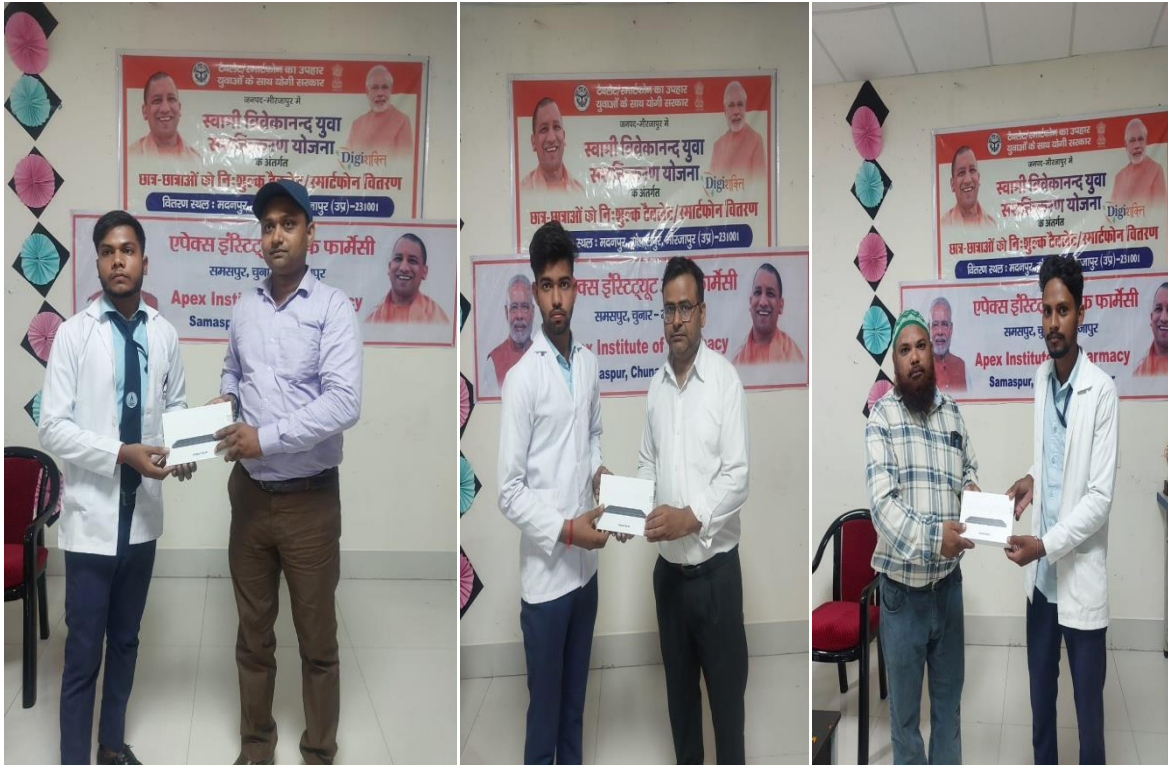
TABLET VITARAN BY ALL FACULTY MEMBERS